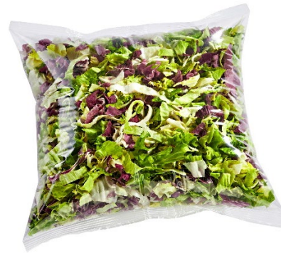
Der Salat wird portioniert und in Beutel verpackt..