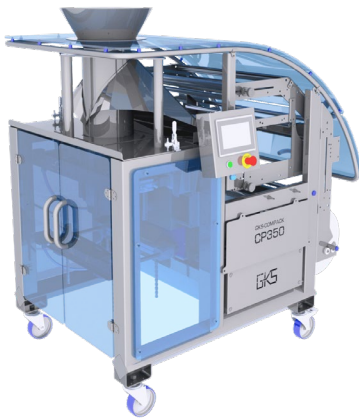
Die Verpackungsmaschine FLEX M verpackt den verzehrfertigen Salat in Beutel.