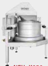
NEU: K650 Trocknungssystem

KRONEN Kundentag 28. September, 9:00–18:00 Uhr