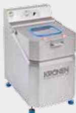
NEUE VERSION: KS 100 PLUS Salatschleuder