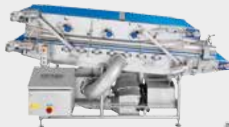
NEU: BDS 3000/800 Trocknungsanlage