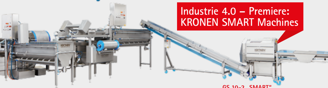
GS 10-2 „SMART“ Bandschneidemaschine

Industrie 4.0 – Premiere: KRONEN SMART Machines