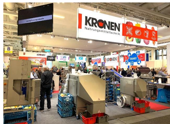
Der Messestand von KRONEN war während der drei Messetage gut besucht. Die Besucher konnten die Maschinen bei zahlreichen Live-Demonstrationen erleben.