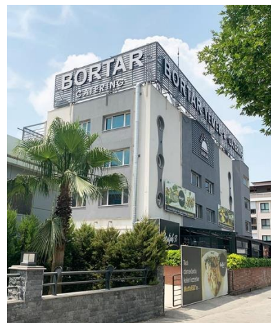
Der Sitz von Bortar Group in Izmir