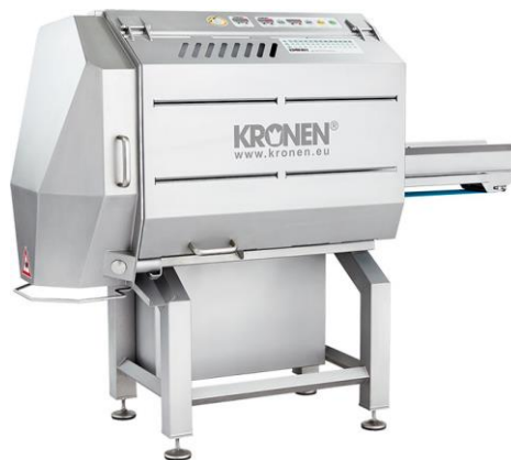
KRONEN Bandschneidemaschine GS 10-2 (neue Generation der GS10)