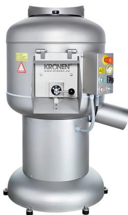
KRONEN Kartoffelschälmaschine PL 40K