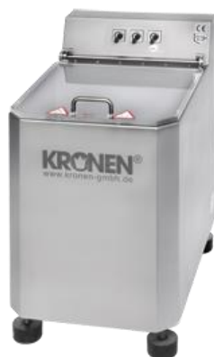
KRONEN Salat- und Gemüseschleuder K50-7 ECO