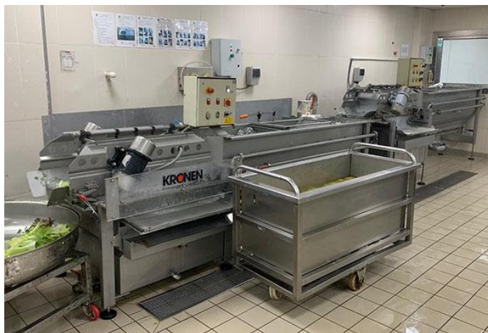
Salatverarbeitung mit einer GEWA 3800V ECO bei Bortar Group